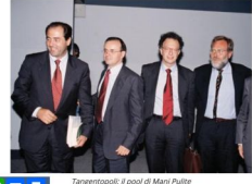
Tangentopoli: il pool di Mani Pulite

Convegno per i 25 anni di Tangentopoli snobbato dagli avvocati di Milano per via della presenza di alcuni relatori "sgraditi"