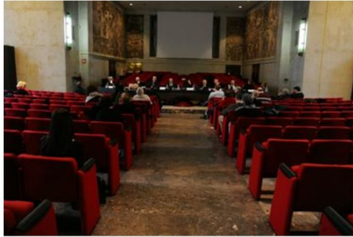
L'Aula Magna del Palazzo di Giustizia di Milano